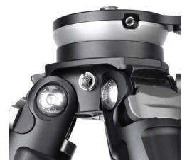
1/4インチ(細ネジ)仕様 アクセサリホール