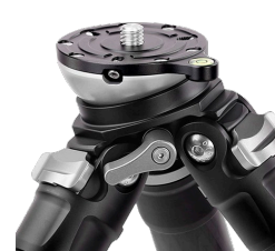
内蔵レベリングベースで ±15°まで調整可能

パイプ径22mmのLS-225CEX+BV-1Rでは、小型のV-Logカムや小型ミラーレス一眼に合わせてとにかく軽量。カメラの持ち味を活かした動画撮影が可能です。