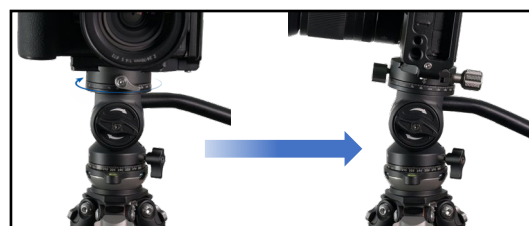
天面のパン機構でカメラの向きも自由自在 ミラーレスカメラにも最適です

天面にパンニング機構を備えた小型ビデオ雲台。コンパクトカメラやミラーレス一眼を、クイックプレートの向きを気にせず取付できます。コンパクトながらスプリングの効いた滑らかな動作が可能で、初めてのビデオ撮影にお勧めです。